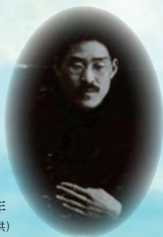
山村 暮鳥 1914年