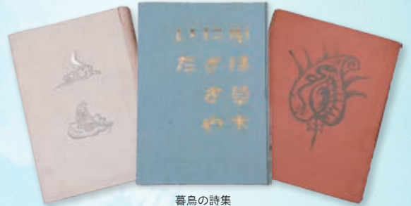
暮鳥の詩集 右から『聖三後玻璃』『風は草木にささやいた』『雲』