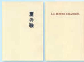
仙台時代に出版したパンフレット詩集 『LA BONNE CHANSON.』 『夏の歌』 (いずれも複製)