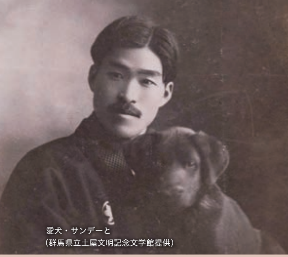
愛犬・サンデーと