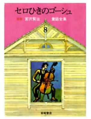
新版宮沢賢治 童話全集8 『セロひきの ゴーシュ』 (1978年 岩崎書店)

無じやい。(ひるまで明るくてなんにもこわいことはない)」「うんう、おつかない。」