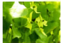
咲き始めのヤマボウシ