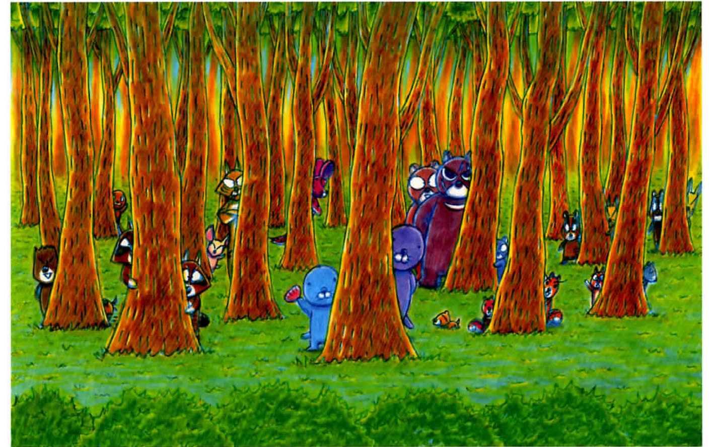
いがらしみきお/竹書房