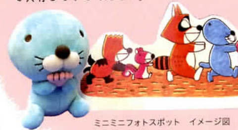
ミニミニフォトスポット イメージ図

お手持ちのマスコットや小さいぬいぐるみなどを撮るための「ミニミニフォトスポット」もあります。写真を撮ったらぜひ「#ぼのぼのたちの杜」で共有してみてください。