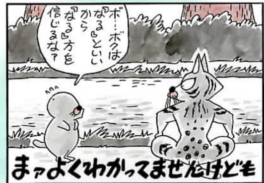
『ぼのぼの』単行本第2巻81ページ原稿より

「ぼのぼの」の魅力のひとつは、どこか哲学的で、やさしく深みのあることばたち。漫画の中に出てきた数々の名セリフの一部を、その場面の原稿とともに紹介します。