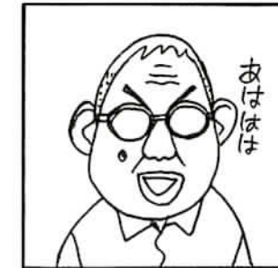
いがらしみきお自画像

1955年生まれ。宮城県加美郡中新田町（現・加美町中新田）出身。1979年に24歳で漫画家デビュー。最大で月に20本以上の連載を抱える人気漫画家となる。1984年に一時休筆宣言。1986年に雑誌『まんがライフ』（竹書房）にて「ぼのぼの」の連載を開始し、現在も連載中。2021年3月に単行本最新第46巻が発売されている。