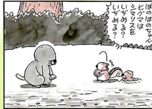
『ぼのぼの』単行本第2巻98ページ原稿より

「ぼのぼの」に登場する森のなかまたちを、印象的なシーンの原稿とともに紹介。いがらし先生からぼのぼの、シマリスくん、アライグマくんなどキャラクターたちへ寄せたコメントは、ファン必見の濃い内容になっています。