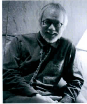
さえき かずみ 講師 佐伯 一麦 (小説家・仙台文学館館長)

小説家で仙台文学館館長の佐伯一麦が、「書くこと」の醍醐味を伝えるエッセイ講座。本講座では、各回事前に出されるテーマに応じて、受講生の方に作品を提出していただきます。講座内では、受講生の方の感想も求めつつ講師が講評を行い、「書くこと」と「読むこと」両方のレベルアップを図ります。実作に挑戦したい方のご参加をお待ちしております。