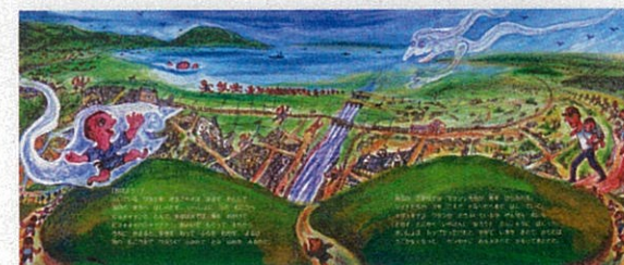
「そもそもオリンピック」(玉川大学出版部)