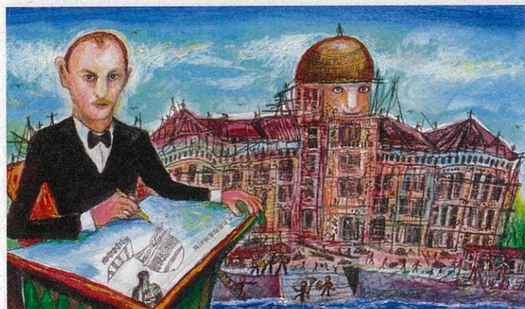
スズキコージ画、アーサー・ビナード作「ドームがたり」(玉川大学出版部)

申込方法: 往復はがきに住所・氏名・電話番号・イベント名を明記のうえ、仙台文学館へ。はがき1枚につき1名の申込み。6月25日(火)必着。申込み多数の場合は抽選。終了後、サイン会有り。当日10時から文学館で本を購入した方先着50名に整理券を配布します。