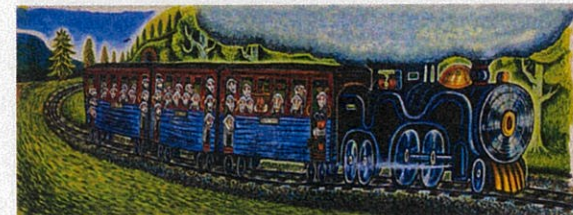
「エンソくんきしゃにのる」(福音館書店)