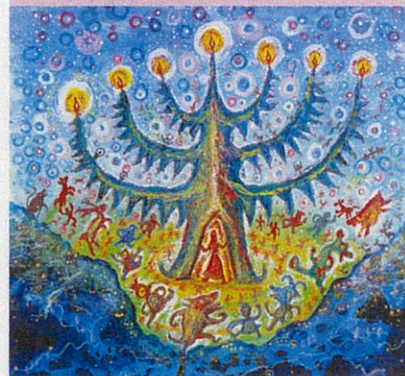
スズキコージ「北野こさい夏祭り」2016年