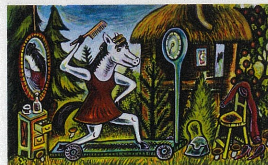
「やまのディスコ」(架空社)