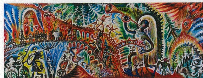
ライブ・ペイント作品「らっぱ姫」2006年