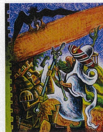
「サルビルサ」(架空社)