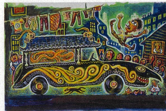
「おぼけドライブ」(ピリケン出版)