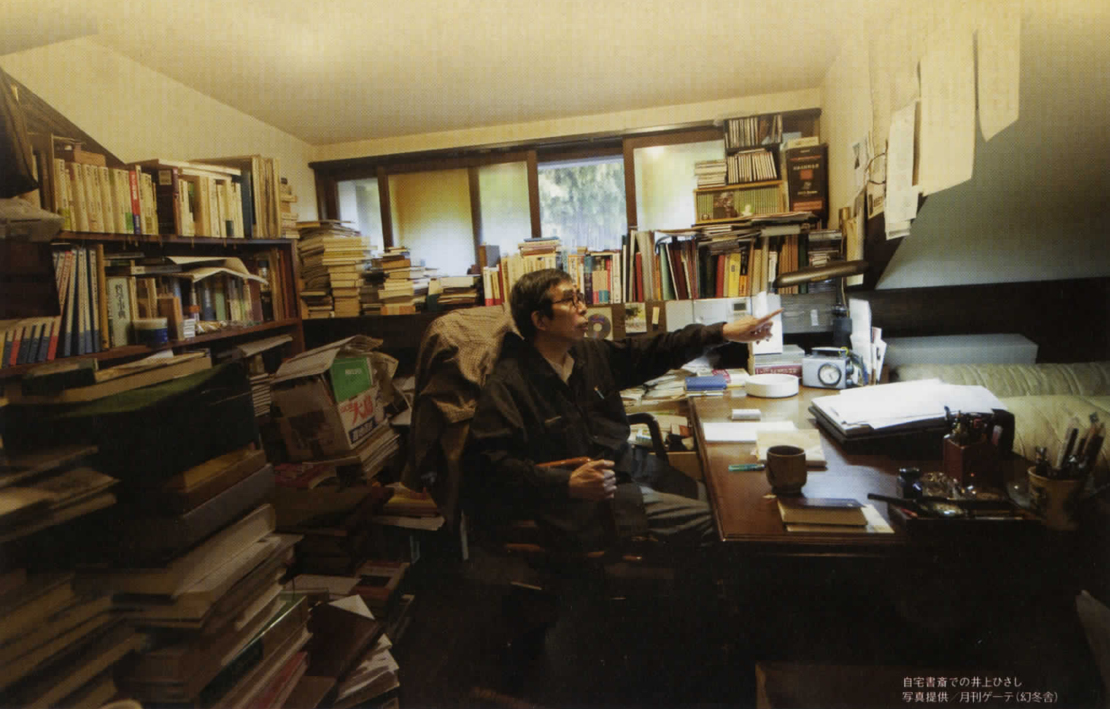
自宅書斎での井上ひさし