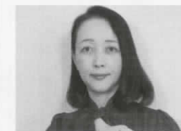
熊谷真弓 (オカリナ奏者)