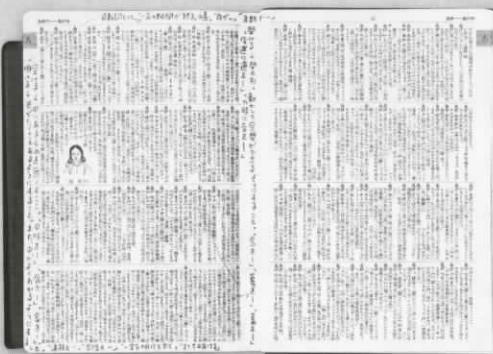
井上ひさしの書き込みがある 『改訂 新潮国語辞典』 (遅筆堂文庫蔵)