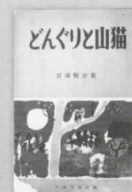
宮沢賢治著『どんぐりと山猫』 (遅筆堂文庫蔵) 井上ひさしが少年時代に、初めて 出版社に注文した本。この本からは、大きな影響を受けた。

ほかの学科も大切ですが、国語、日本語というのは、これからみなさんが生きていくうえでほんとうに大事な道具です。道具というよりもっと大事なものです。だまされたと思って、一所懸命、言葉を勉強してほしいとおじさんは念願しています。