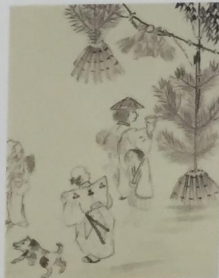
天明3年(1783)から4年にかけて発生した天明飢饉の状況を描いた絵に見える佐沼(登米市)付近の門松

こうした仙台北下で用いる門松の材料は、根白石村から納めるのが恒例となっていました。門松を納めるのは8つの家に限られ、その家の当主は「御門松上人(おんかどまつあげにん)」と呼ばれていました。御門松上人たちは租税の一部を免除されるなどの特権を与えられていましたが、五階の松など大きな材料を集めるのには、毎年相当に苦労したようです。